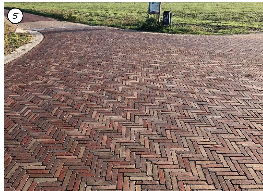
Figuur 59: Kruising Opmeerder Wuiver volledig uitgevoerd in gebakken klinkers