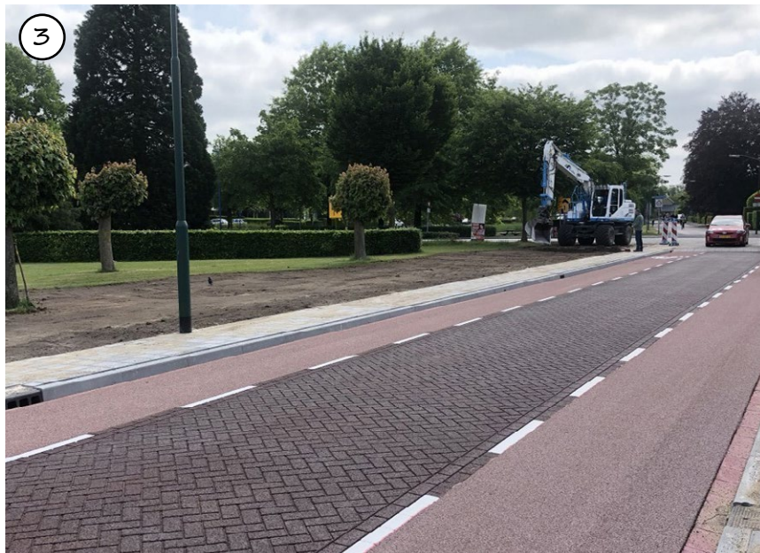
Figuur 54: Asfalt met streetprint als materialisering van ontsluitingsweg