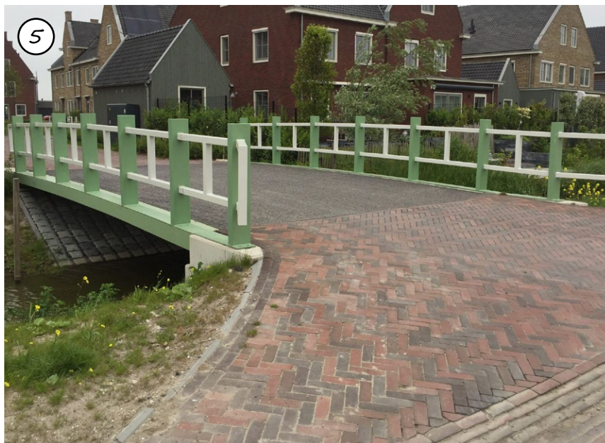
Figuur 58: Onderscheid in materiaal tussen overbrugging en Opmeerder Wuiver