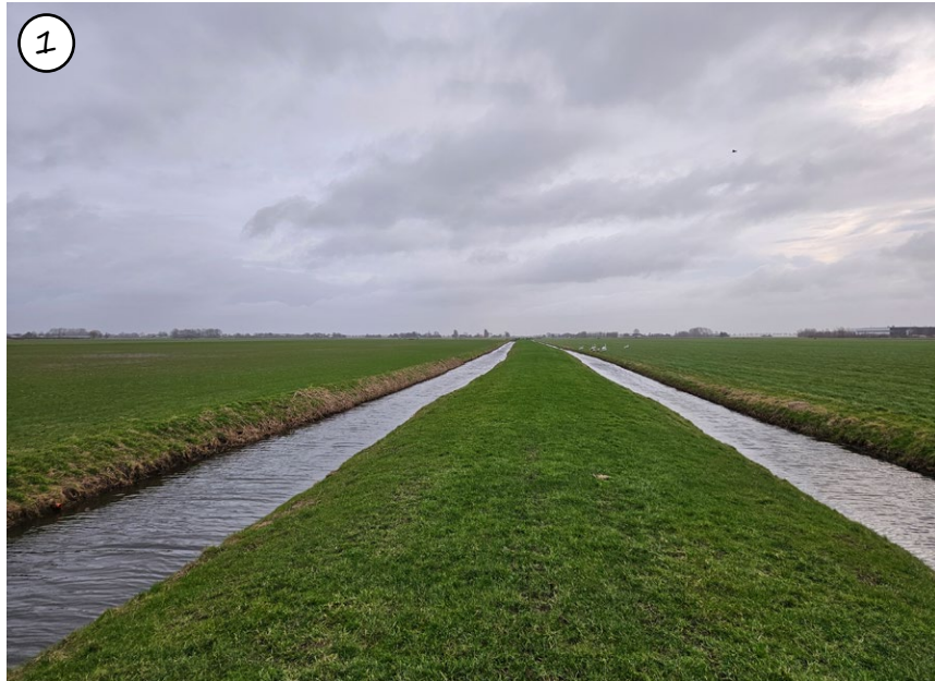
Figuur 57: Bestaande situatie Opmeerder Wuiver