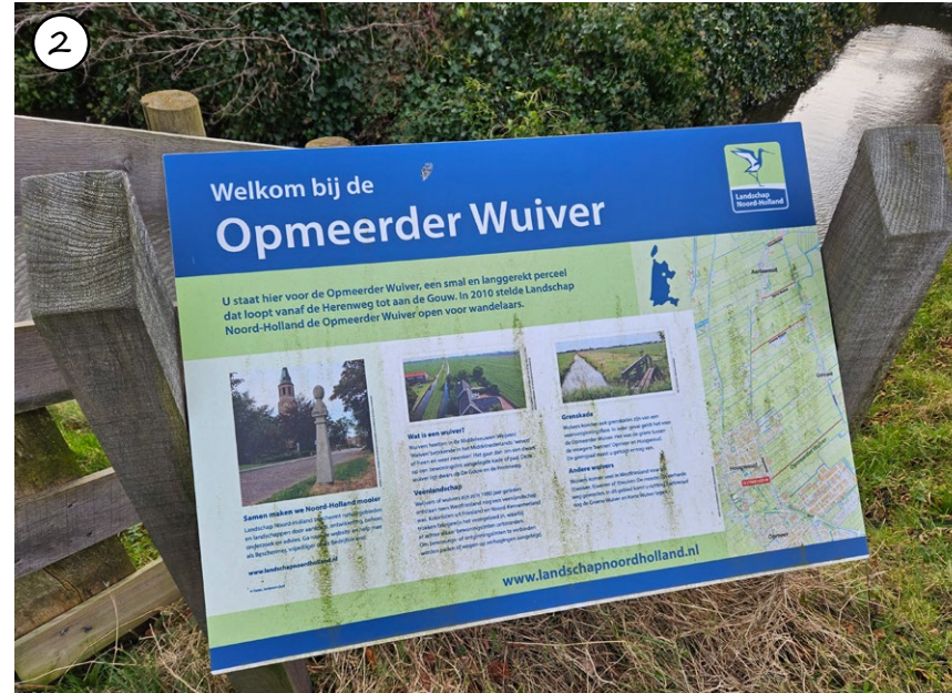
Figuur 56: Informatiebord bij toegang struinpad Opmeerder Wuiver