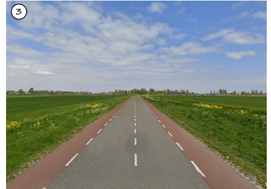
Figuur 55: Profiel nieuwe ontsluitingsweg, asfalt met suggestiestroken