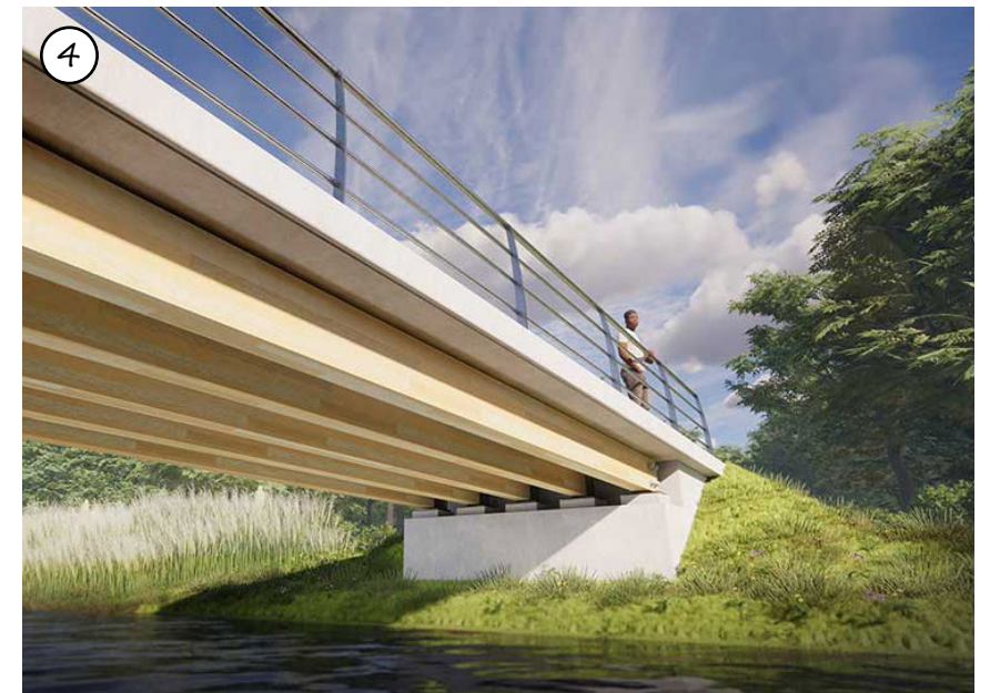
Figuur 52: Ecologische verbinding onder overbrugging