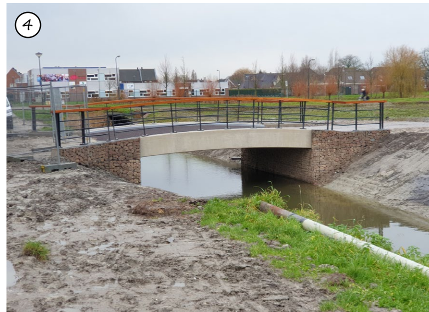
Figuur 53: Subtiele overbrugging over de twee greppels aan de Opmeerder Wuiver