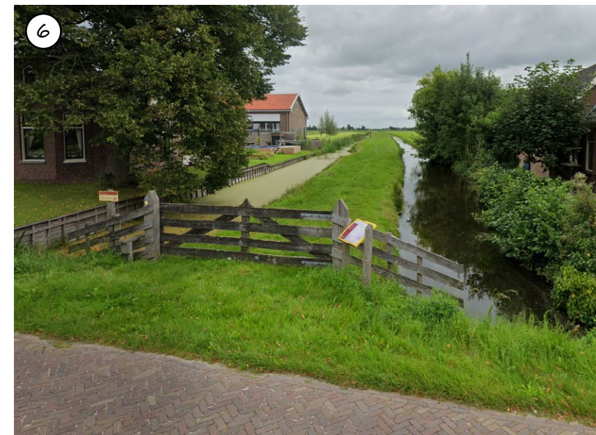
Figuur 60: Hekwerk als afsluiting van de weg en accentuering van de Opmeerder Wuiver